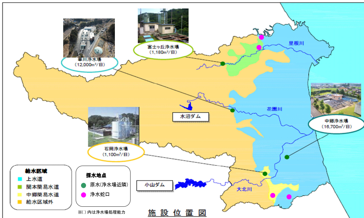
図2 給水エリア及び採水箇所（場所等については表9）