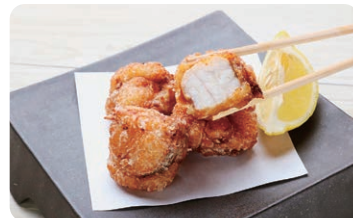
▲あんこう専門店のあんこう唐揚げ