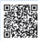
▲ 国税庁 LINE 公式アカウント

【注意事項】 マイナンバーカードのパスワード〔署名用電子証明書用（英数字6～16桁）と利用者証明用電子証明書用（数字4桁）〕が必要です。