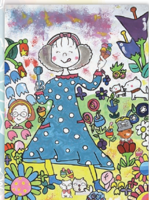
わかったさんのアイスクリーム 根本 虹香さん(大津小学校4年)