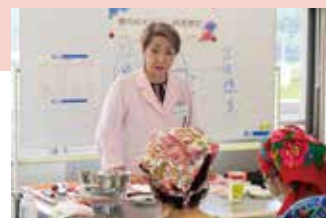
講師は茨城新聞にレシピを連載中!