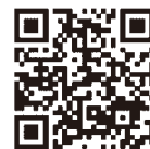
認証キーの取得方法 発注者への提出方法