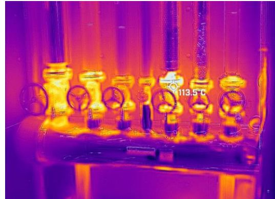
サーモカメラによる配管の放熱状況の計測