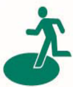
緊急指定避難場所