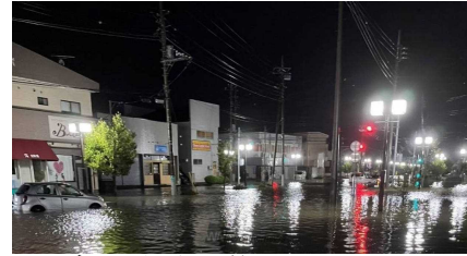
令和5年台風第13号による 県内の浸水被害の様子