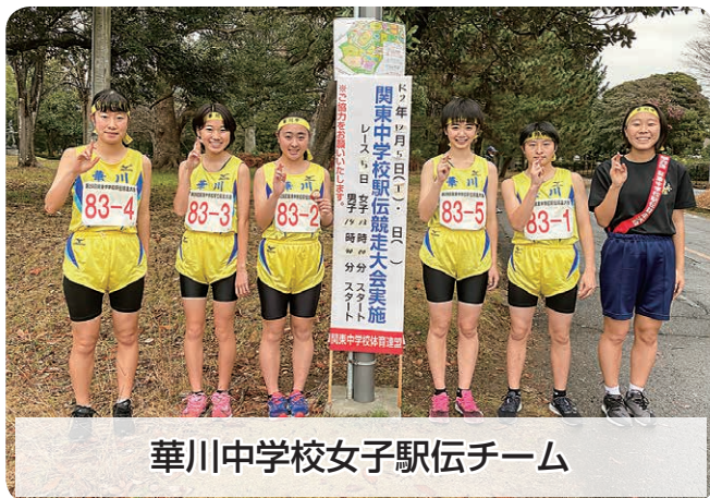
華川中学校女子駅伝チーム