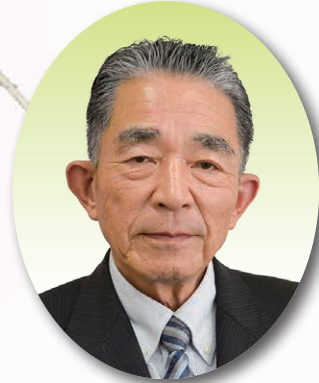
北茨城市議会議長 鈴木 啓一