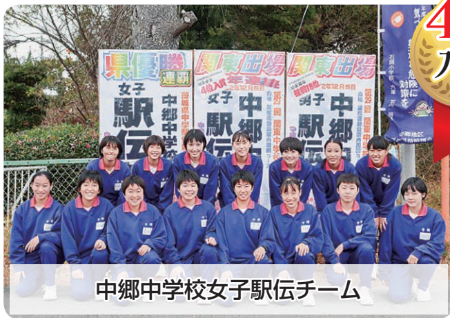
中郷中学校女子駅伝チーム