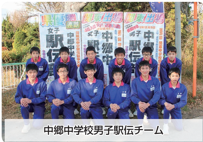
中郷中学校男子駅伝チーム