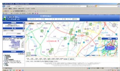
いばらきデジタルまっぷ（地図情報）