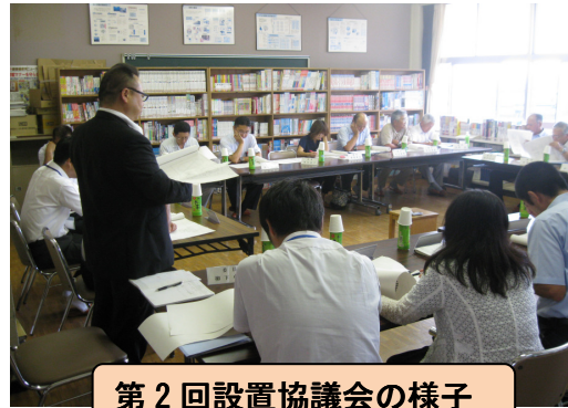
第2回設置協議会の様子

委員の皆さんからのさまざまなご意見を新しい一貫教育校へ向けて検討を重ね、一つのかたちにしていきます。