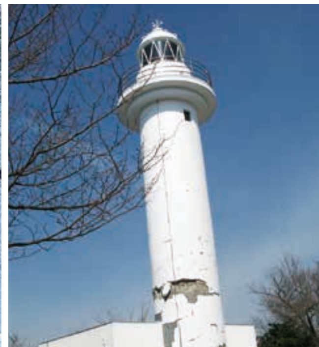
折れて使用不能となった大津の灯台