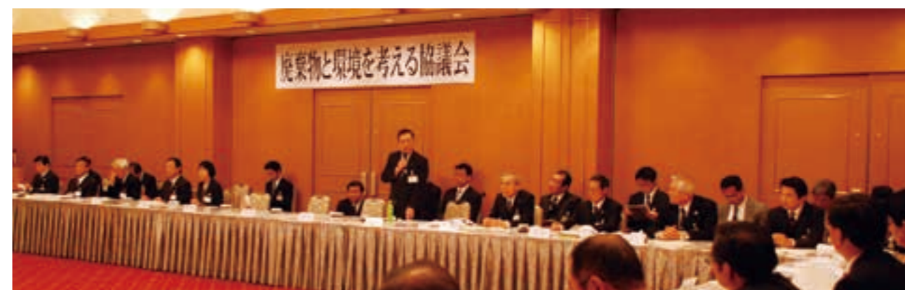
廃棄物の減量と資源化の促進により環境保全を図る「廃棄物と環境を考える協議会」が発足 (平成25年)