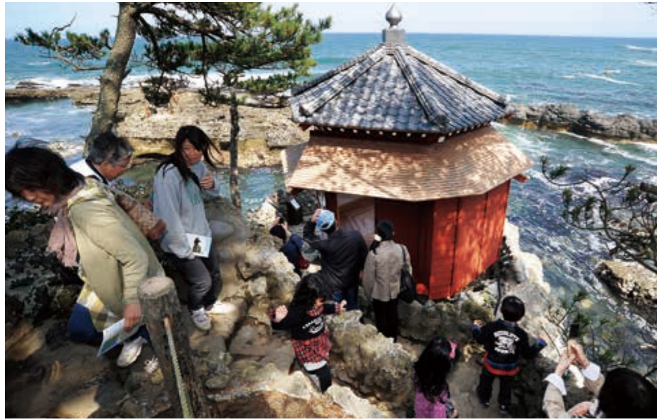
津波で流失した六角堂が茨城大学によって再建され、一般公開が始まった（平成24年）