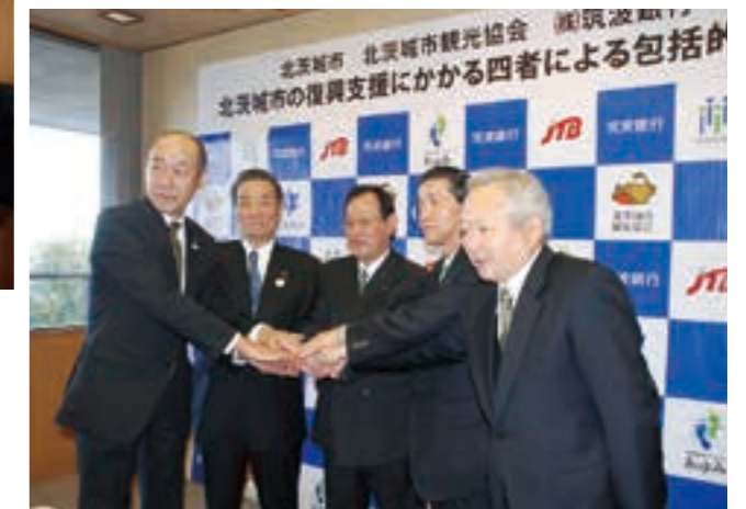
北茨城市の復興支援にかかる4者による包括的提携協定が結ばれた（平成24年）