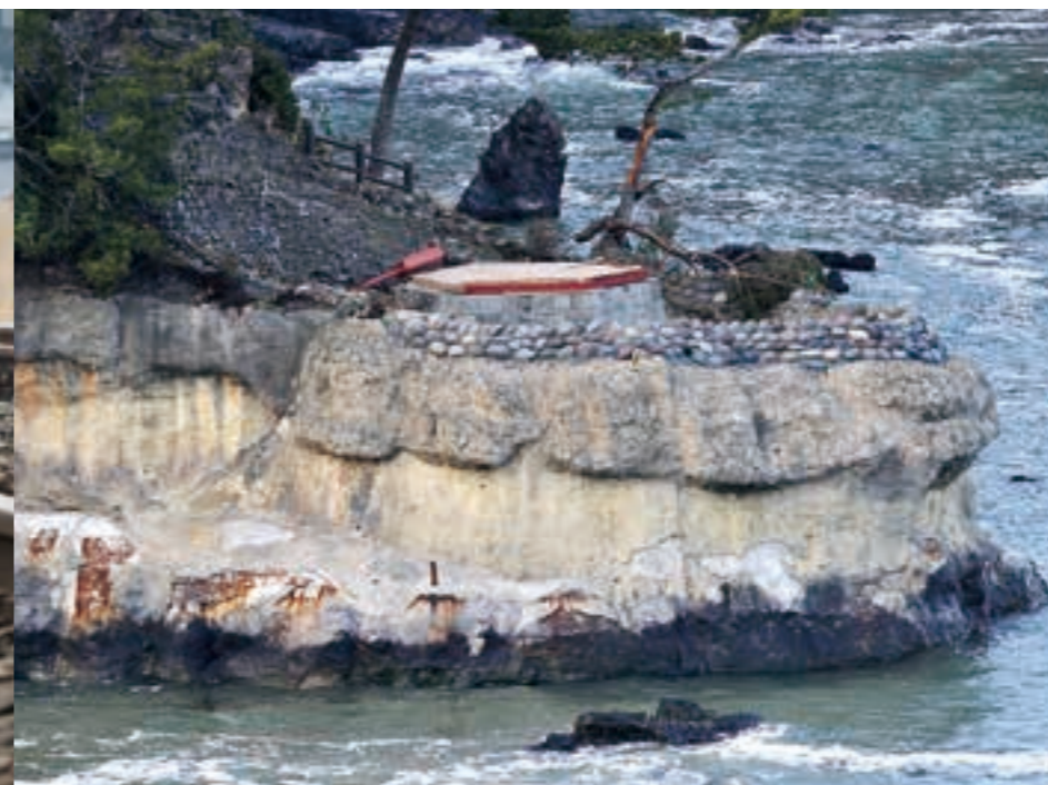
津波により流失した六角堂