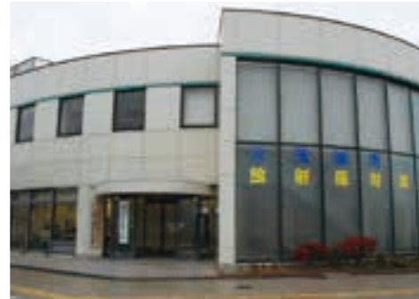
磯原駅西口に設置された放射能対策プラザ。放射線測定器の貸し出しを始めた（平成23年）