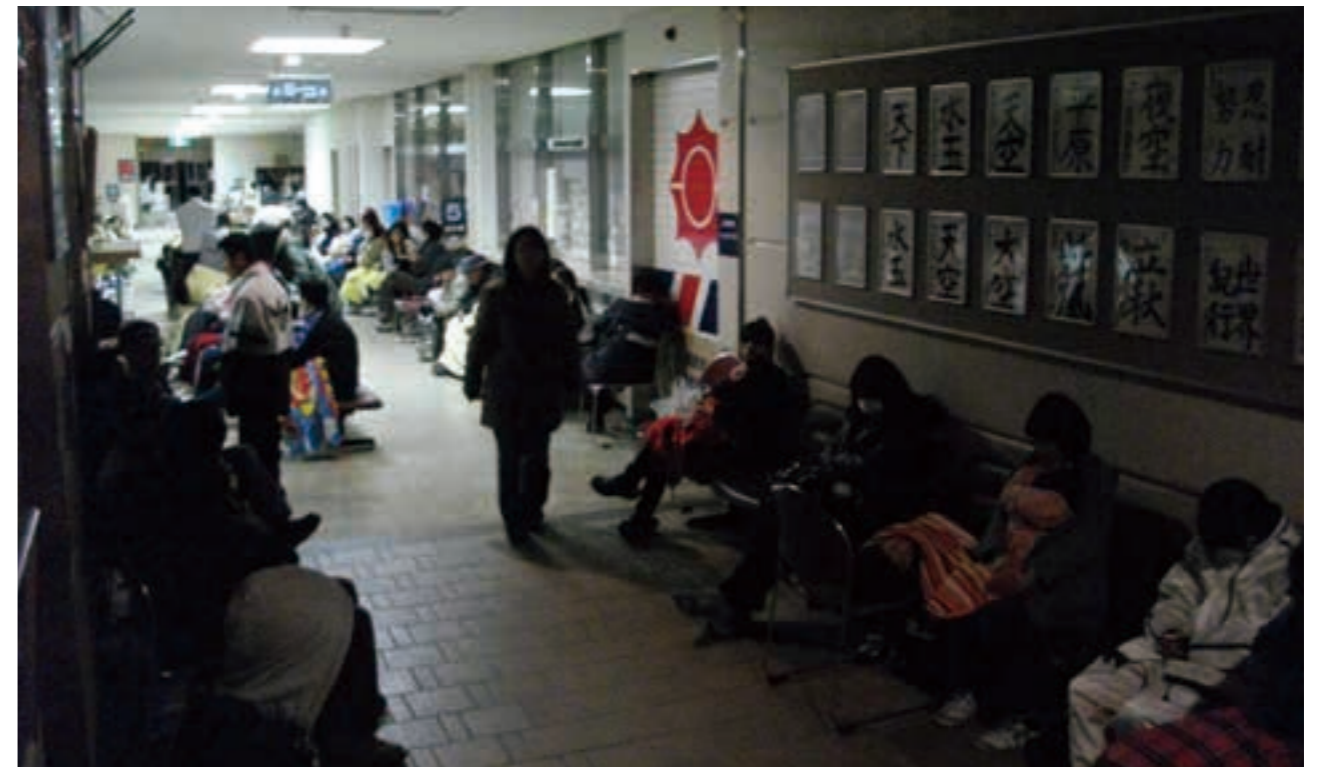
震災発生当日、避難した市民は不安な一夜を過ごした（北茨城市役所）