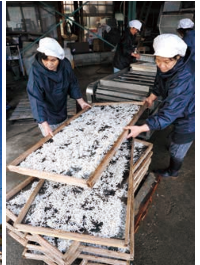
震災発生から約2年ぶりに大津町でシラス漁が再開（平成25年）