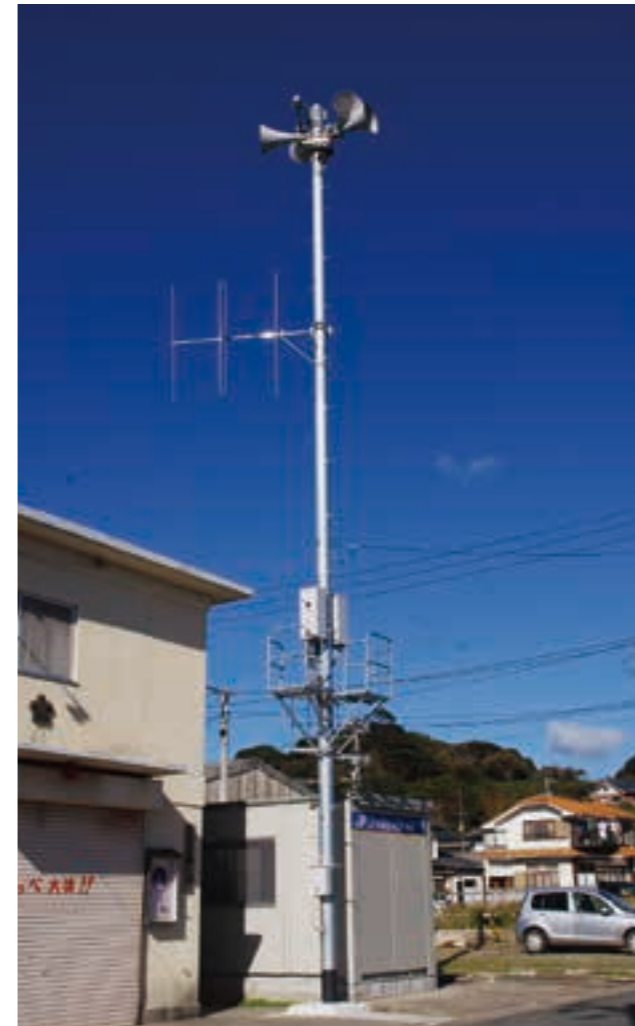
情報を市民に伝える防災行政無線の整備が進められた（平成25年）