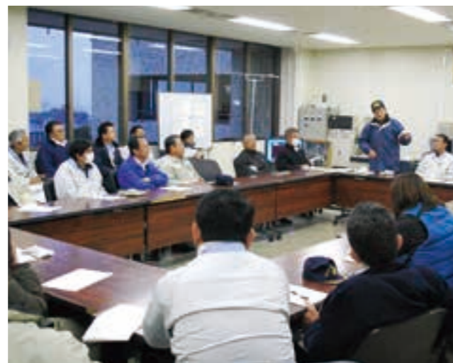
震災後の対応を進めた災害対策本部会議