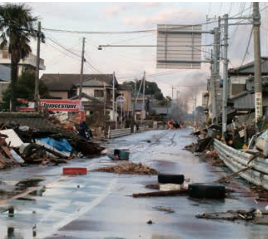
津波が引いた後の国道6号磯原駅入口付近