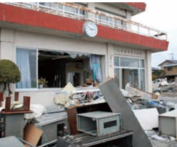
1階天井まで津波に飲まれた大津漁協。時計の針は震災発生時刻で止まった