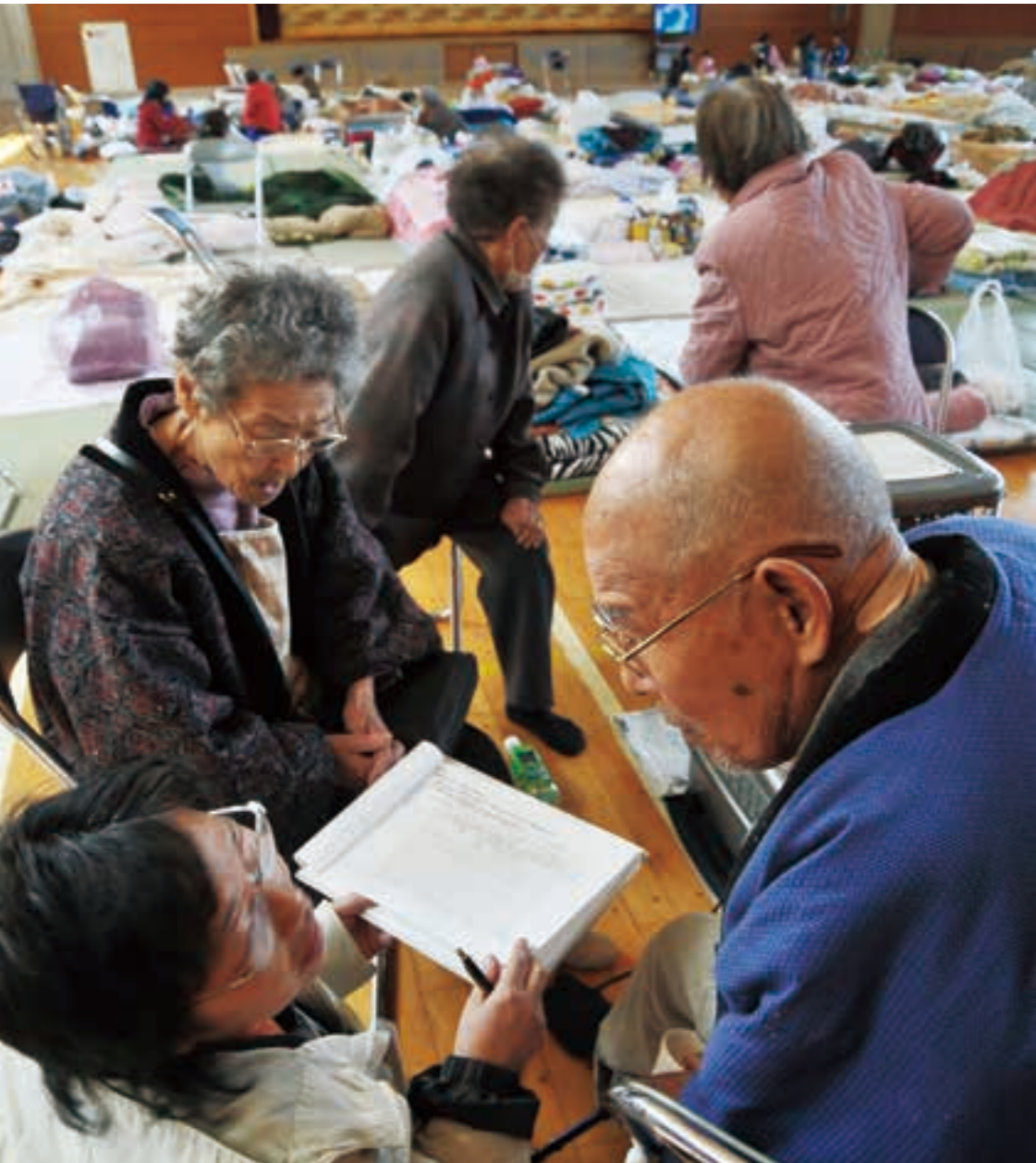
磯原町沿岸部の避難所となった市民体育館。避難所数は一時20カ所にまで拡大し、最大で5,100人が身を寄せた