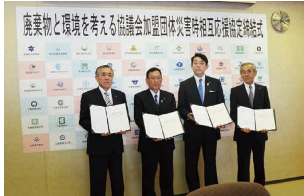
65団体と災害時相互応援協定を締結。震災を契機に自治体や各種団体との協力体制づくりが進められている（平成25年）