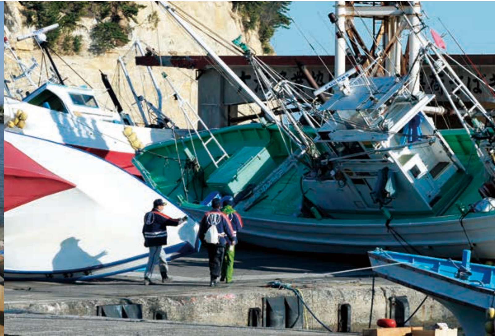
岸壁に打ち上げられた漁船（大津町）