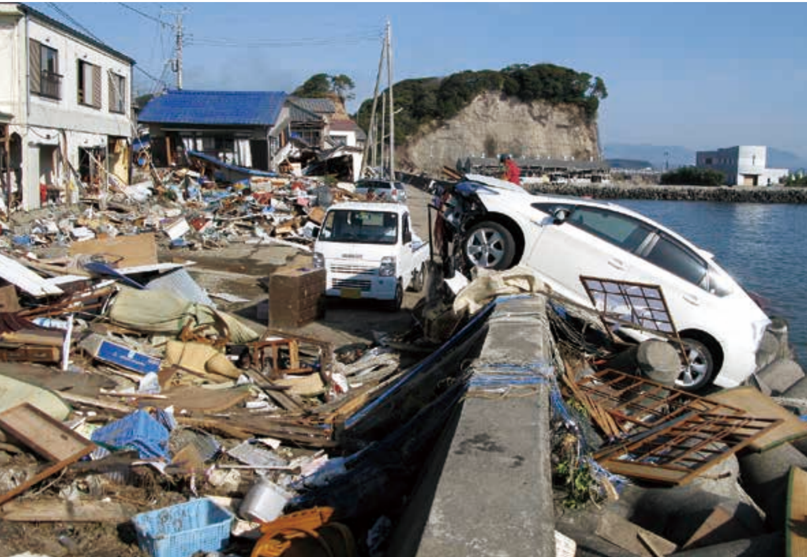
津波に襲われ、家具や車などが折り重なった住宅地（平潟町）