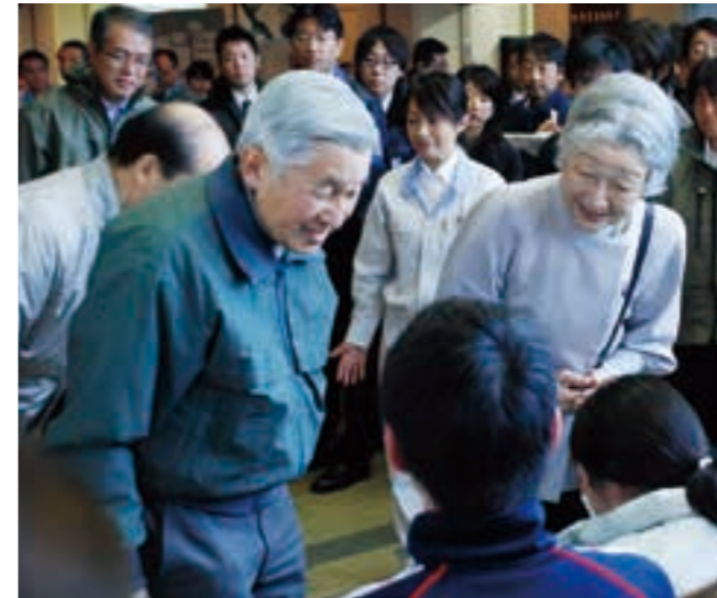
被害のお見舞いのためご来市された天皇、皇后両陛下