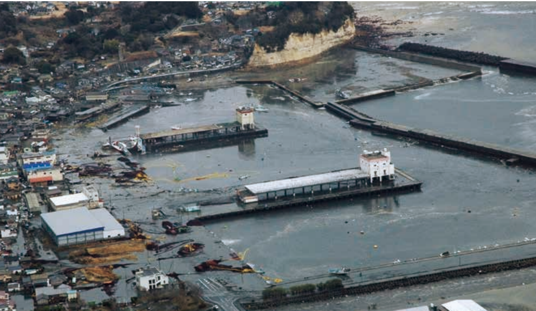
太平洋沖で発生した地震による津波は、市内沿岸部に大きな爪あとを残した（大津港周辺、平成23年）