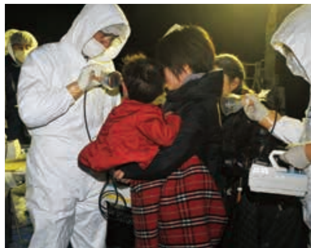
福島県側から県内に入る避難者のスクリーニングテストをする職員ら（歴史民俗資料館）