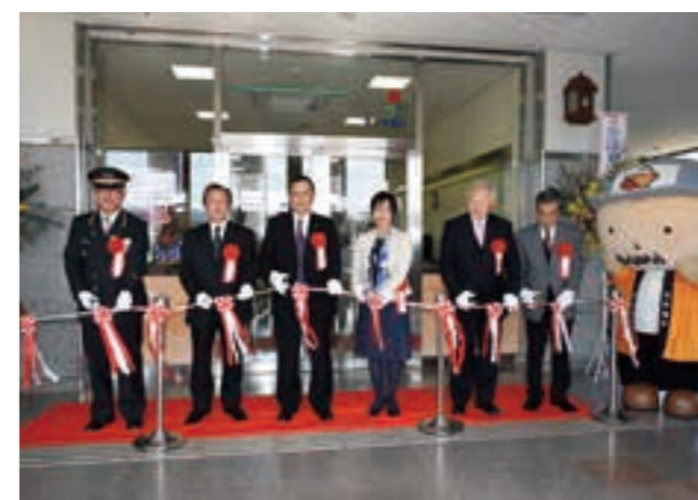
JR常磐線磯原駅に北茨城市観光案内所を開設 (平成27年)