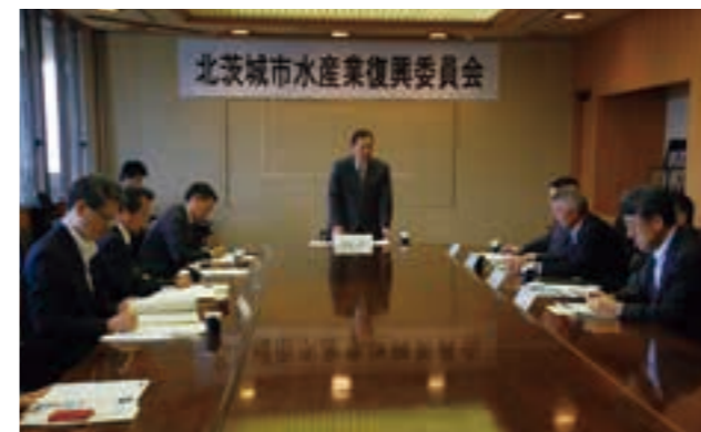
北茨城市水産業復興委員会が発足した（平成24年）