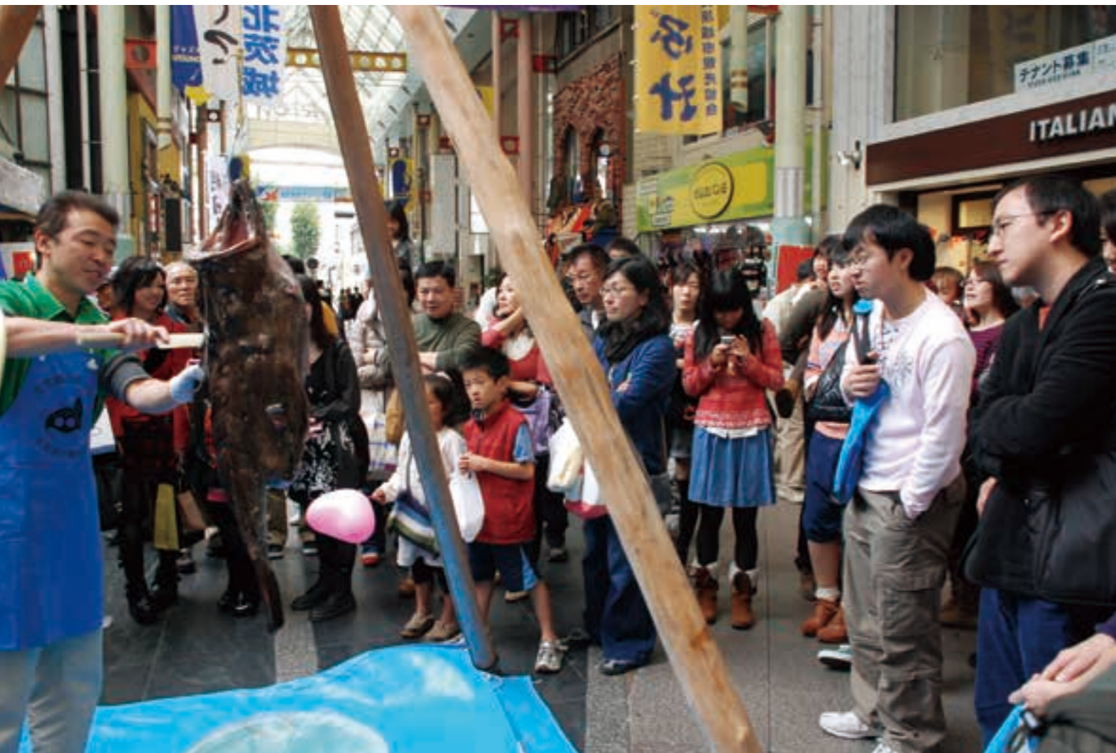
市と市観光協会が宇都宮市の商店街にアンテナショップを出店（平成23年）