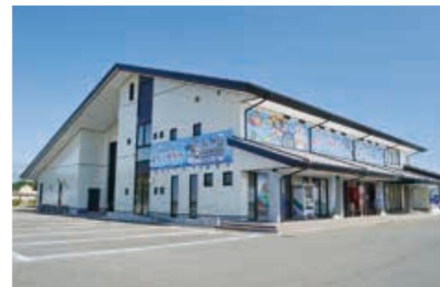
津波で被害を受けていた市漁業歴史資料館「よう・そろー」がリニューアルオープン（平成25年）