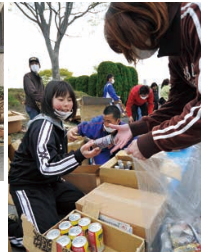
食料品や生活用品などの支援物資を手渡すボランティア（大津町）