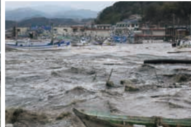
高波が港を越え、流される漁船