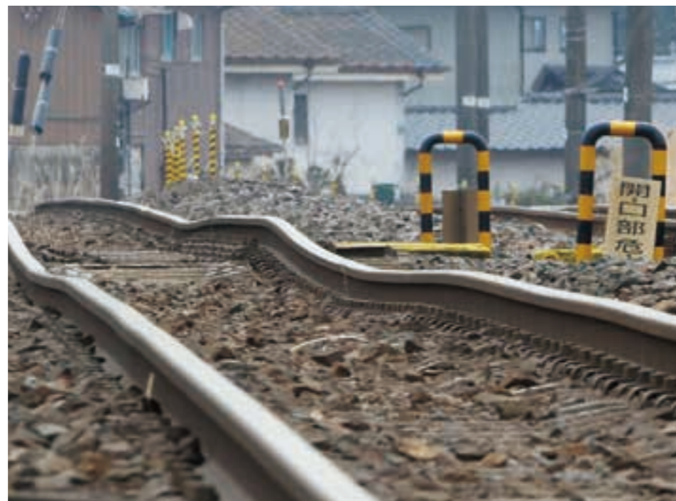
地震でゆがんだJR常磐線の線路