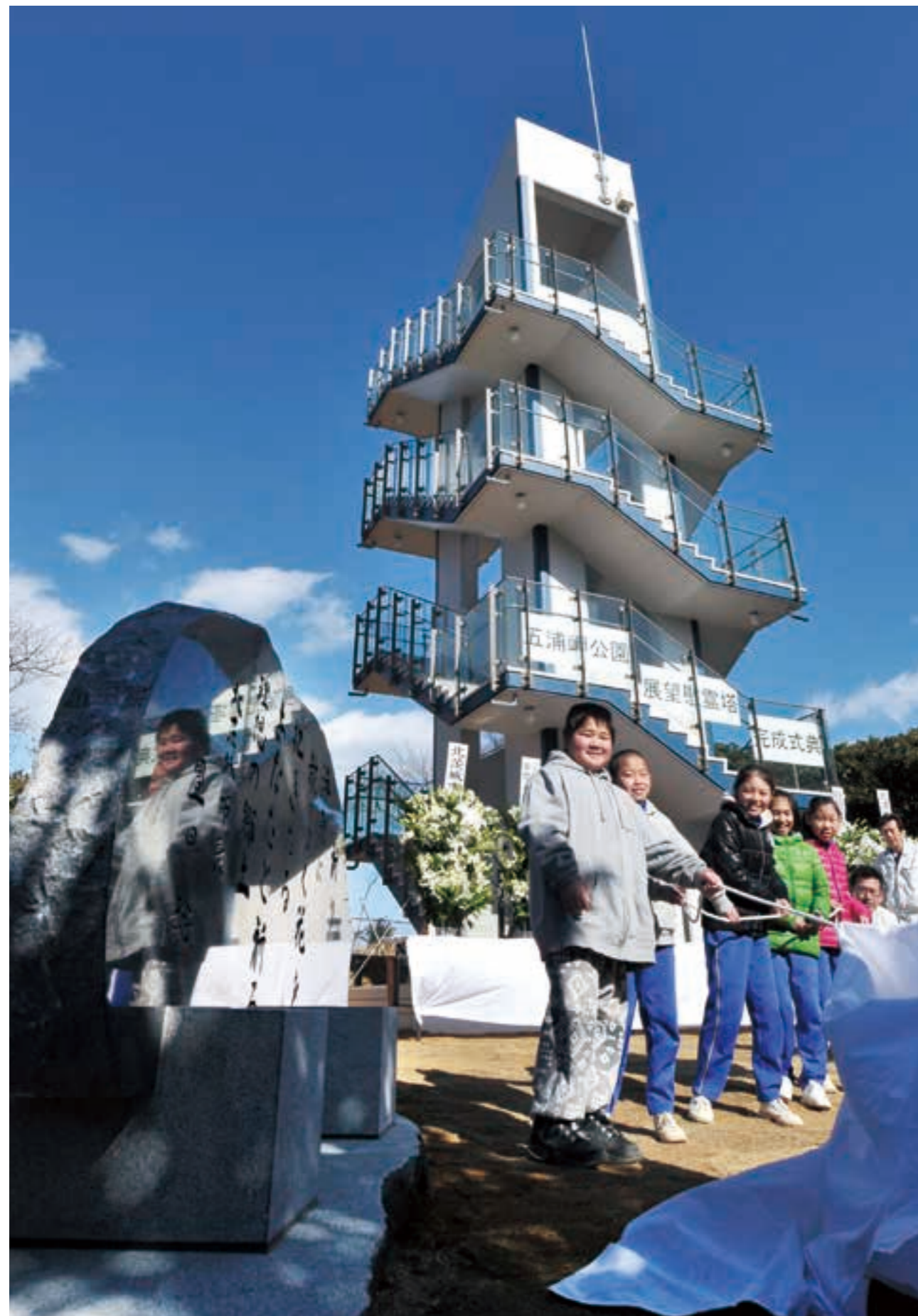
大津町の高台に設けられた展望慰霊塔の前で、祈りの碑を除幕する子どもたち (平成26年)