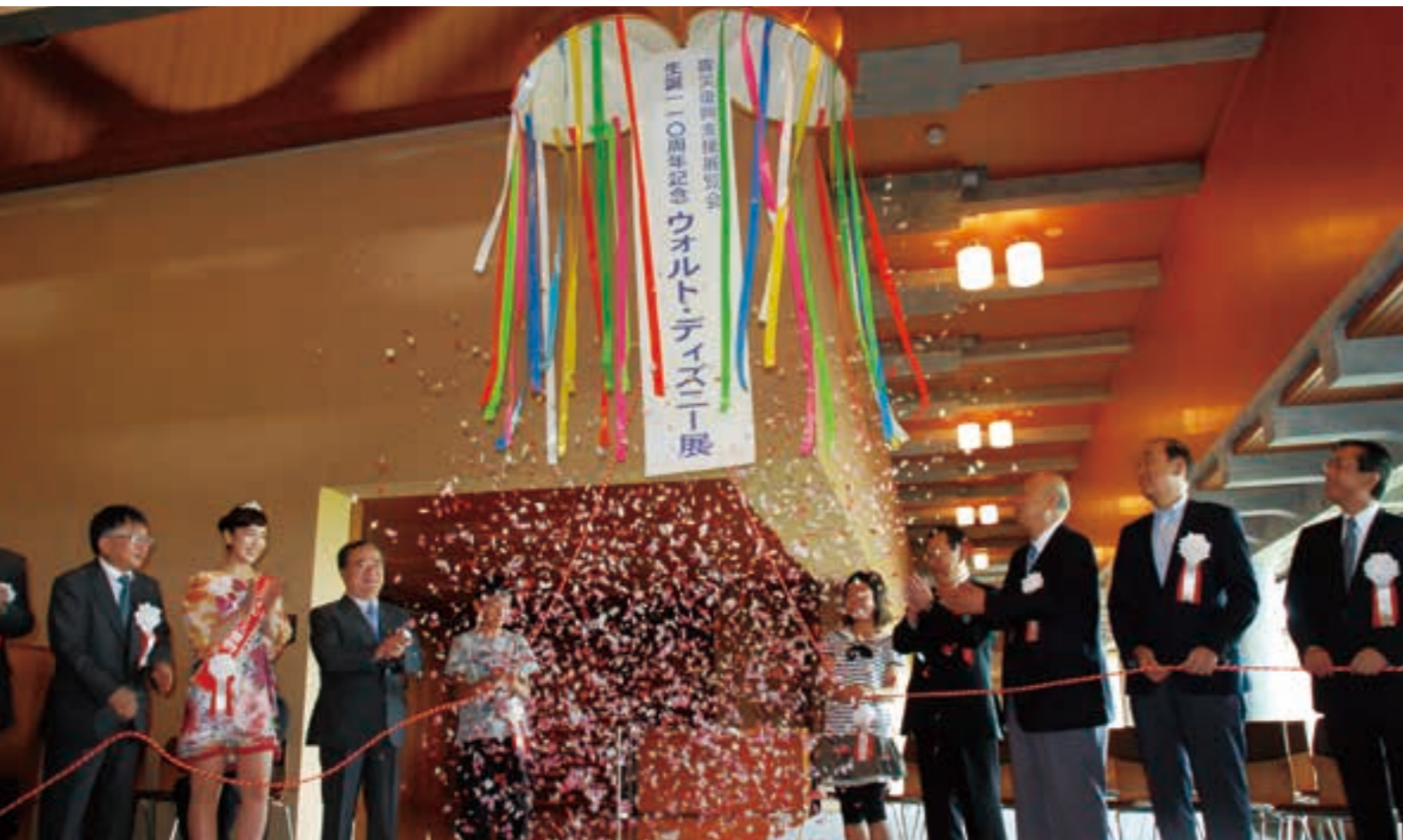
震災復興支援展覧会「生誕110周年記念 ウォルト・ディズニー展」が、県天心記念五浦美術館で開幕。52日間の入場者は約11万人を超えた（平成24年）