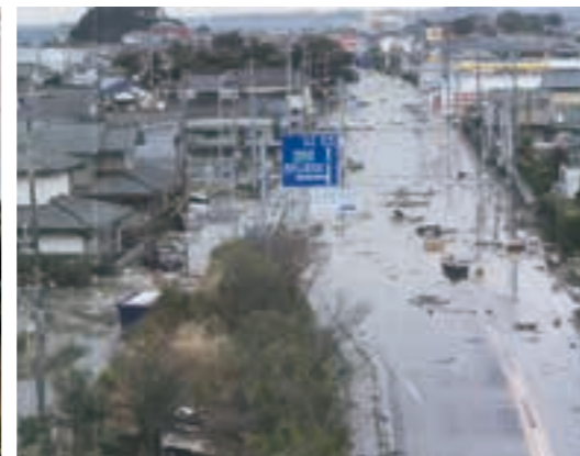
津波は国道6号とその周辺まで押し寄せ、街並みを一変させた（二ツ島陸橋から）