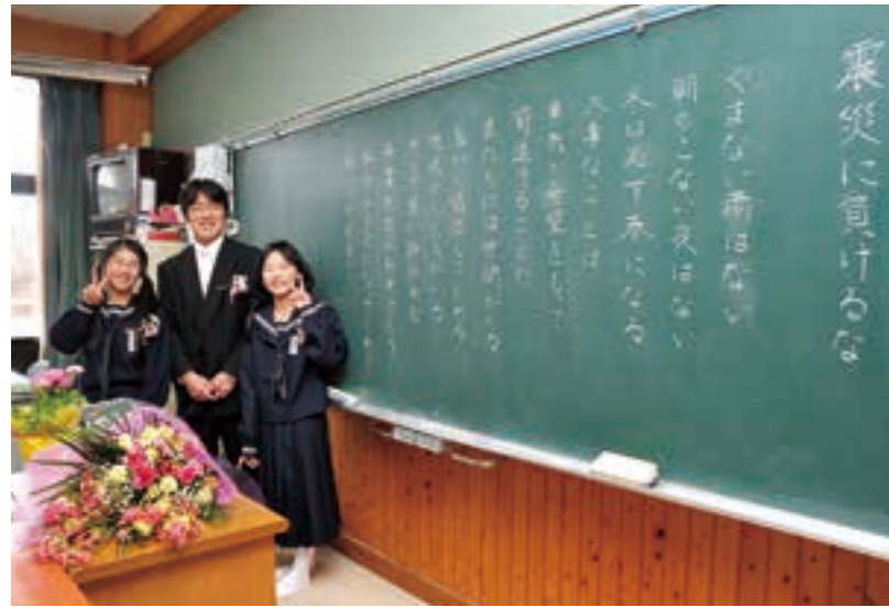
被災して間もない3月末、大津小学校で卒業式が行われた（平成23年）