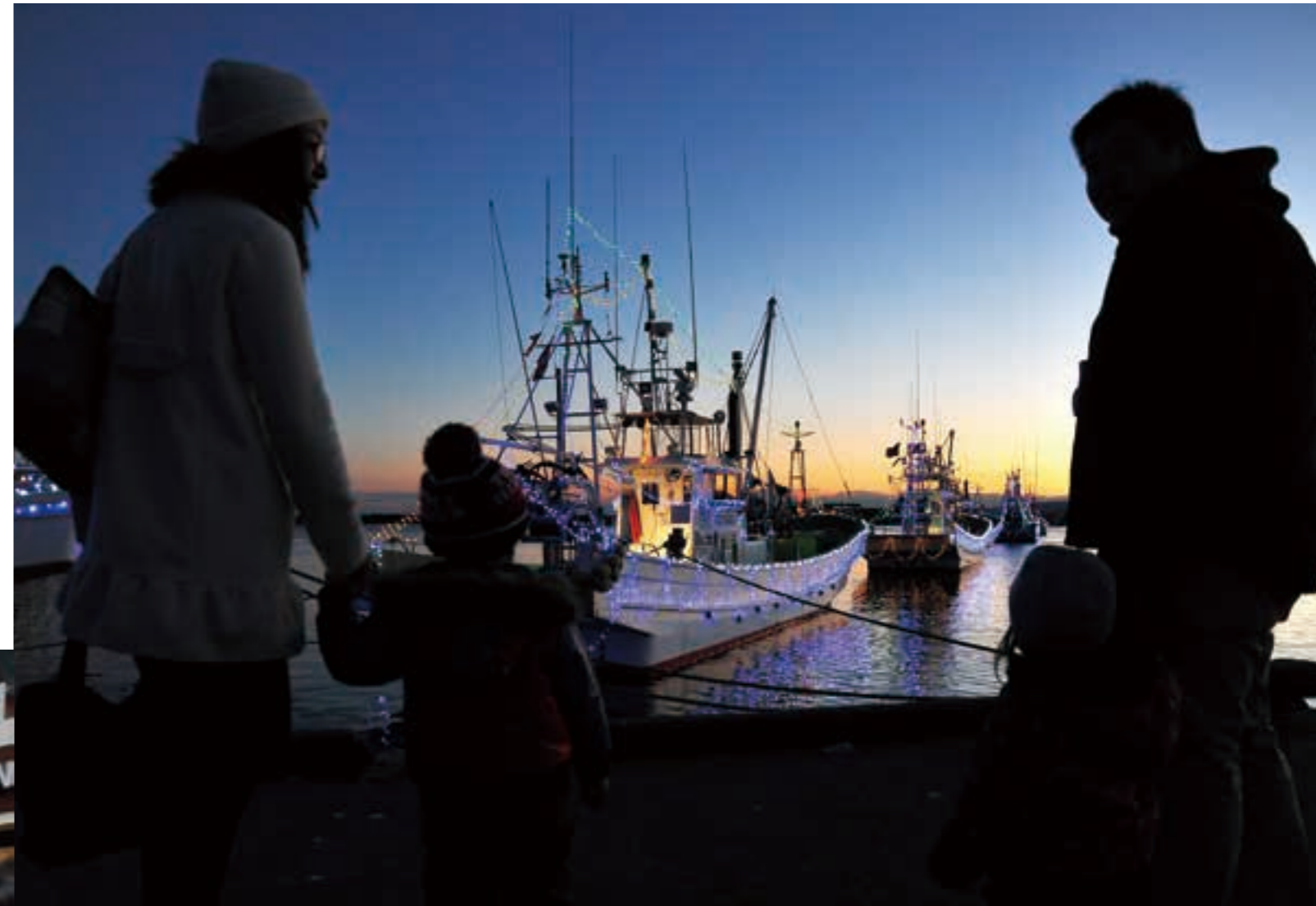
クリスマス期間中、大津漁港で行われたパトゥ・ノエル。「希望の船出」をイメージして、ライトアップされた漁船が夕闇の港を彩った（平成23年）