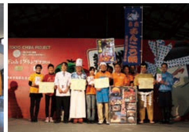
築地市場まつり「鍋グランプリ」で、あんこう鍋がグランプリ(平成26年)