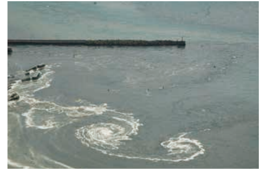
引き波が渦を巻く仁井田浜