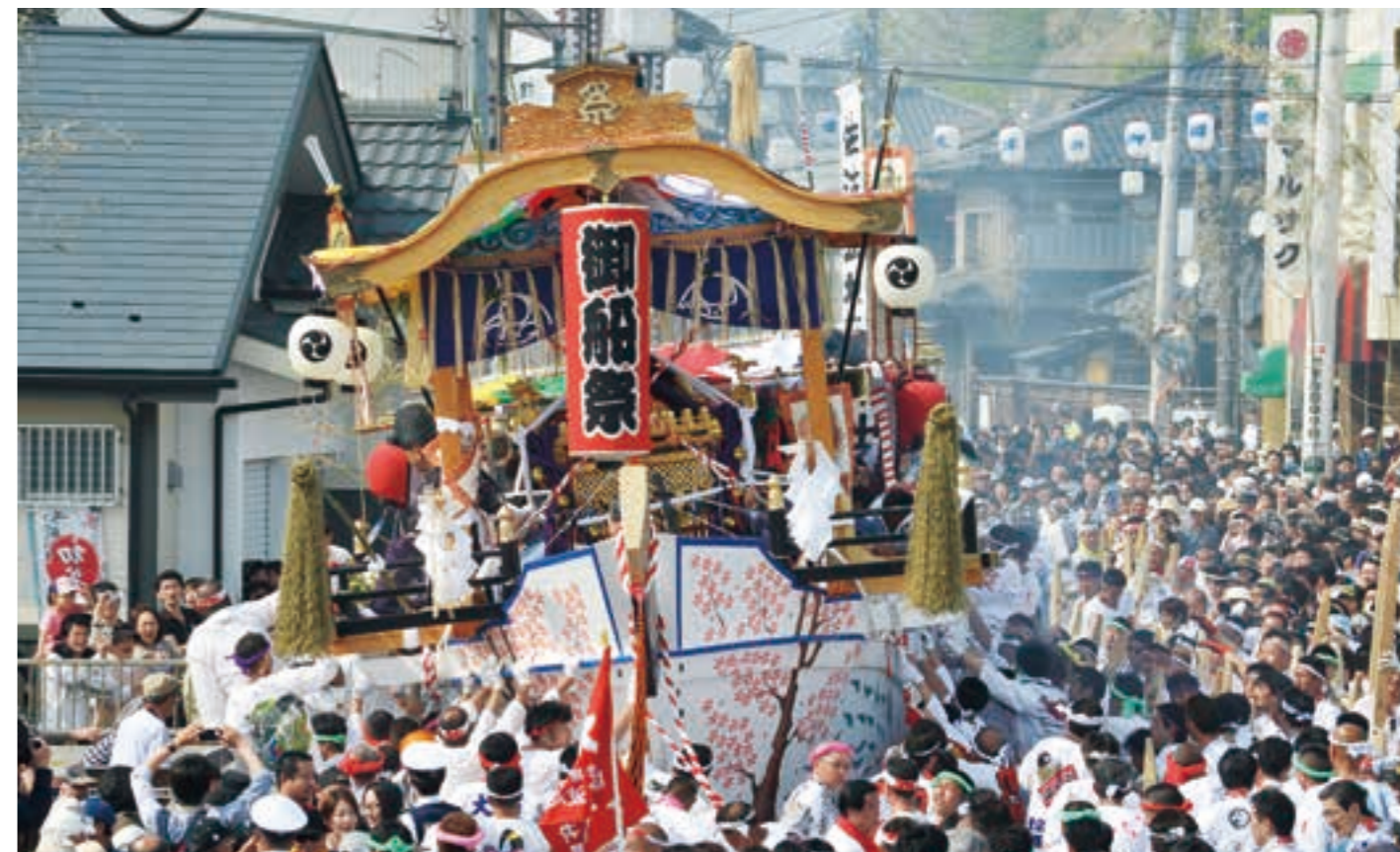
復興を願い震災後初の御船祭が開催された (平成26年)