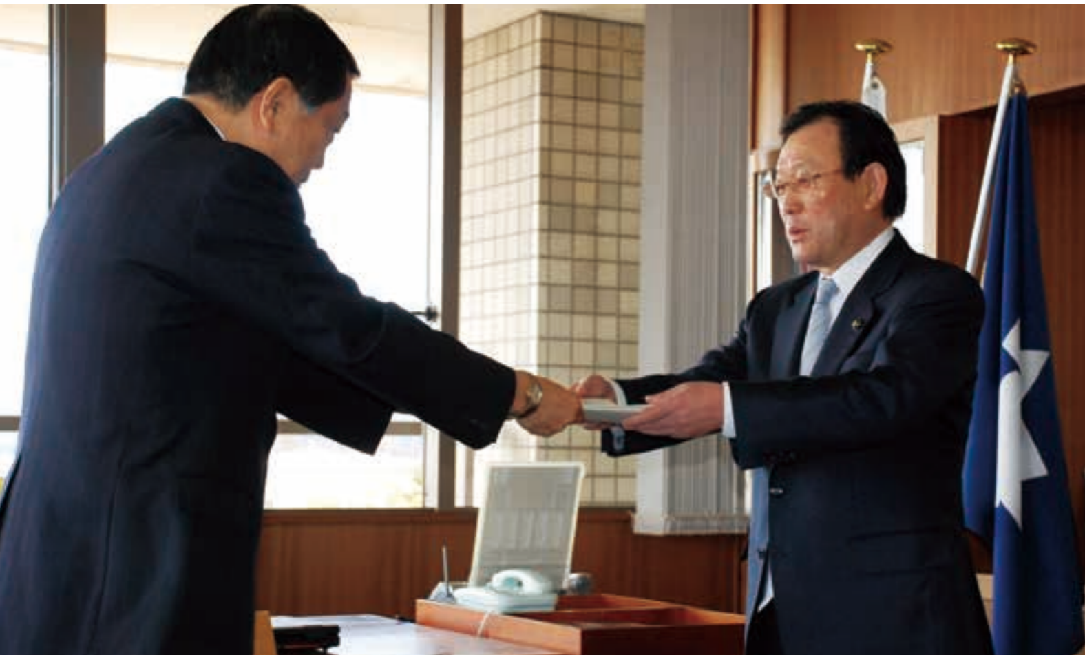
震災復興計画策定委員会から復興計画案が答申された。この計画をもとに、復興のまちづくりが始まる（平成24年）